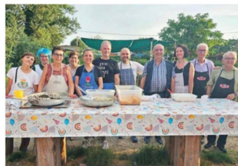
Un'immagine della giornata di Ferragosto al centro di accoglienza Porta Aperta